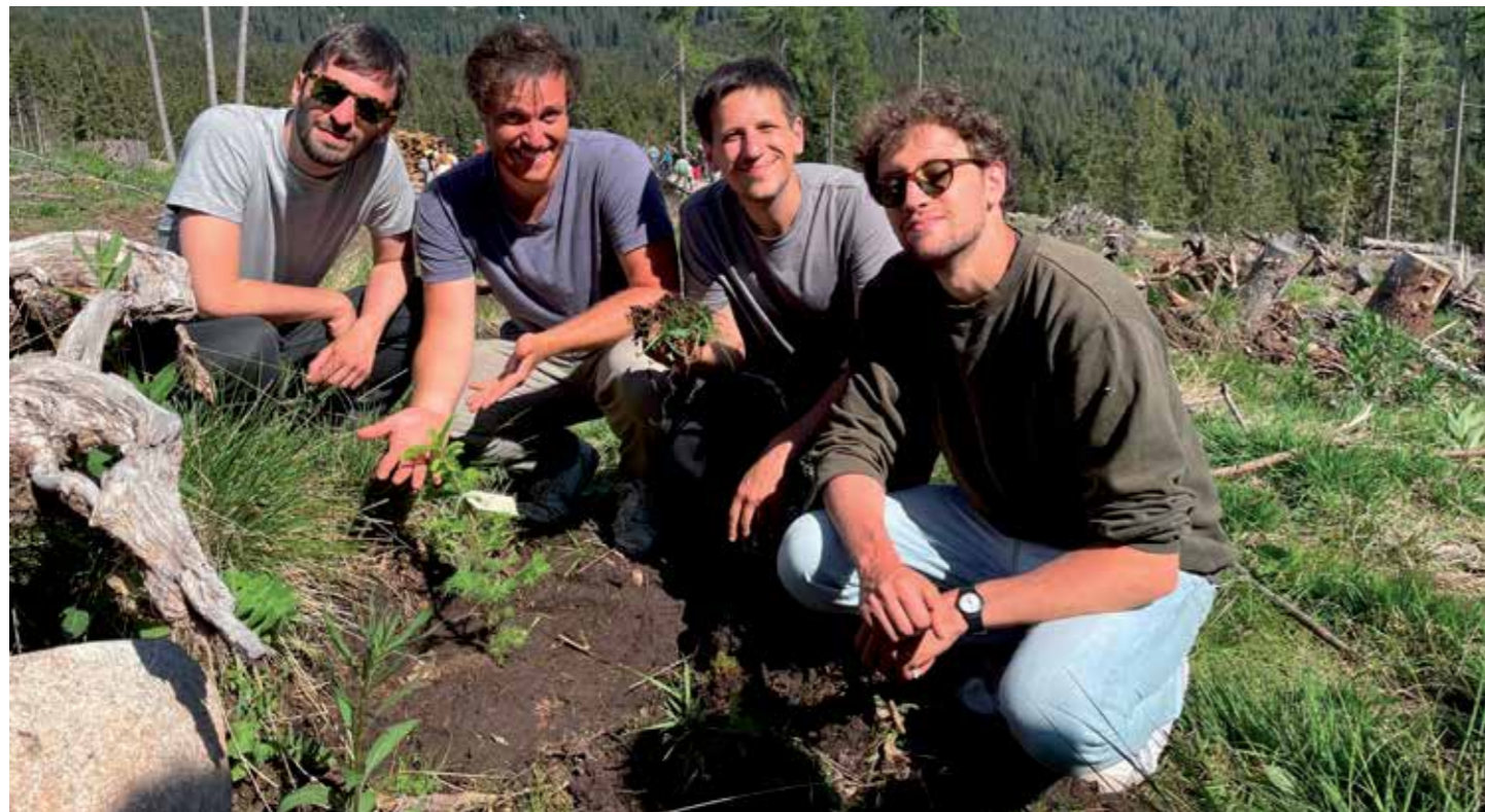
Gli Eugenio in Via di Gioia mettono a dimora un abete rosso nella foresta di Paneveggio.