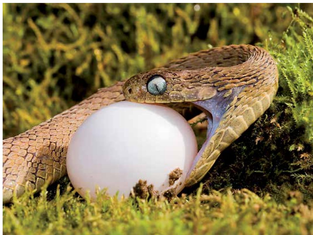
Inizia la merenda del serpente mangiatore di uova.

Per il panda rosso niente più buono delle tenere foglioline di bambù, una pianta molto comune nelle zone