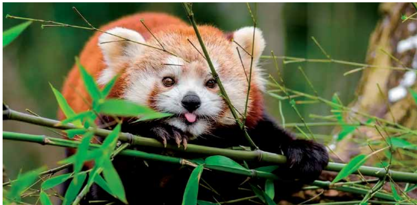
La merenda a base di foglie di bambù del panda rosso.

Mammiferi, rettili, roditori, uccelli: anche loro, come noi umani, hanno i